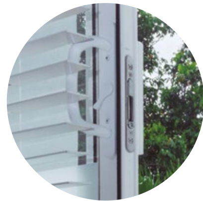
Ventanería en PVC termoacústico