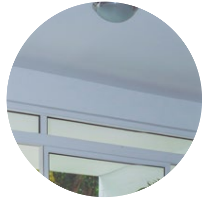
Diseño de techos altos