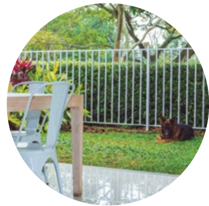
Casas con jardín interior y patio posterior