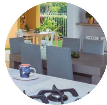
Ahorro en servicios públicos* *Para casas con acabados