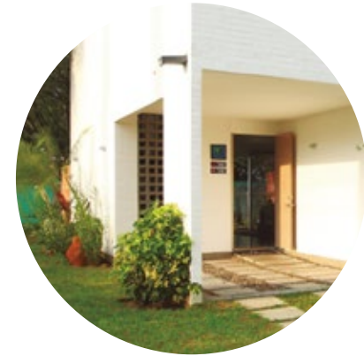
Fachadas en colores claros