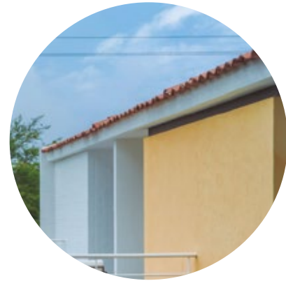
Techos con teja de barro