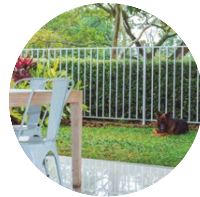
Casas con jardín interior y patio posterior